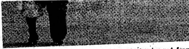
This picture taken on November 18 and released from North Korea's official Korean Central News Agency (KCNA) on November 19 shows North Korea's leader Kim Jong Un (R) walking with his daughter as he inspects a new intercontinental ballistic missile (ICBM) "Hwasong Gun 17", at Pyongyang International Airport.

She gave birth to their first child the following year, with their second and third born in 2013 and 2017, the agency